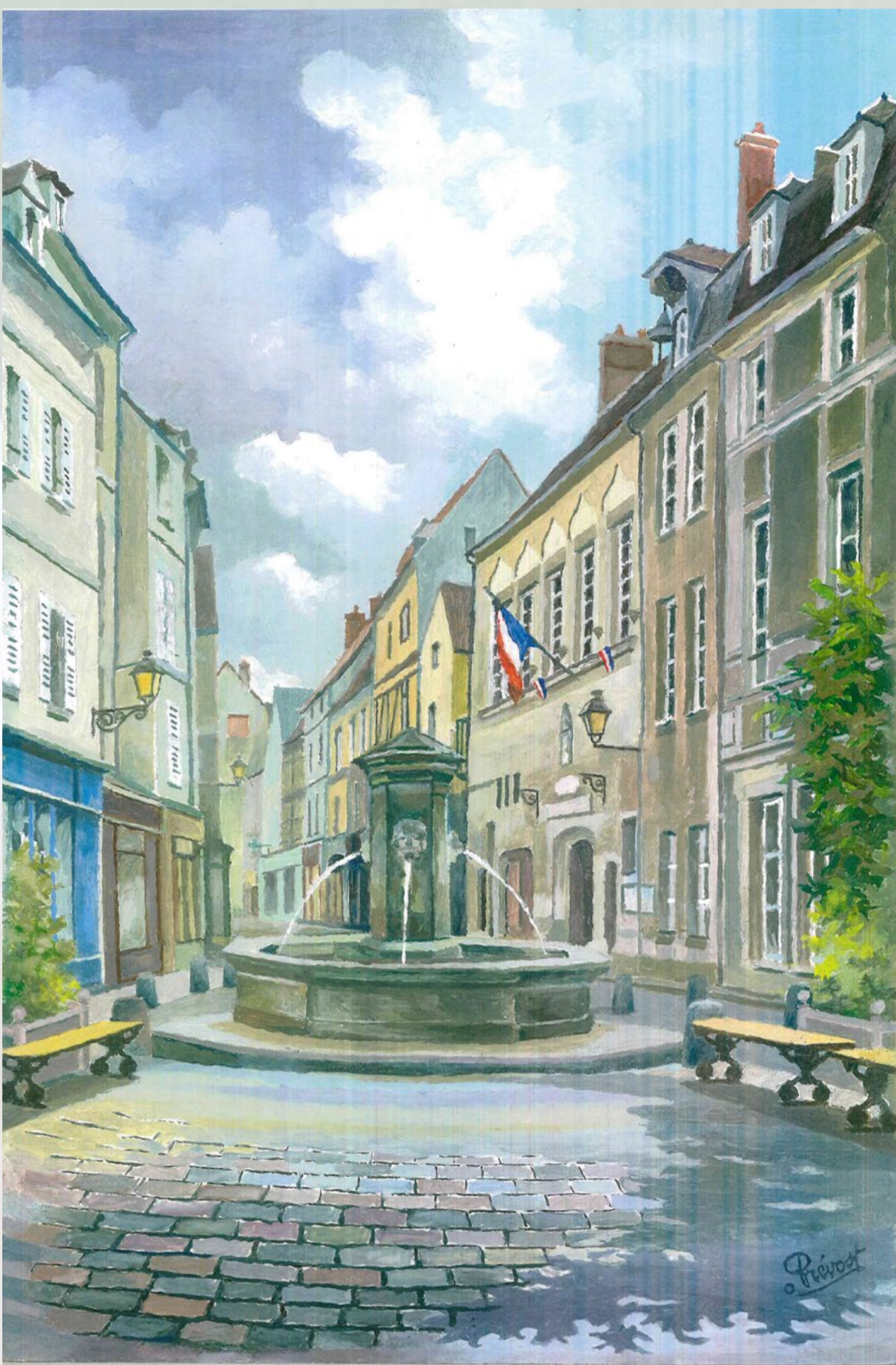
Place Henri IV

Une peinture « de plein air » est, le plus souvent, peinte « sur le motif » : une œuvre peinte à l'extérieur, dans la nature, devant le sujet (souvent un paysage) comme l'ont fait les pré-impressionnistes et les Impressionnistes, avec leur matériel (châssis entoilé et chevalet)